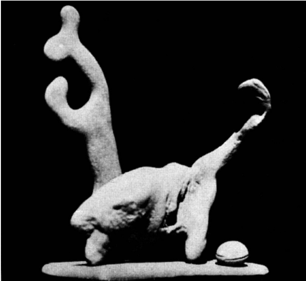
"Dinny the Dinosaur"